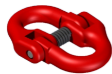
ENGANCHE RÁPIDO CADENA QUICK HTICH CHAIN ATTELAGE RAPIDE CHAÎNE SCHNELLKUPPLUNG FÜR KETTE