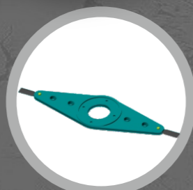
PLATO DE CUCHILLAS BLADE PLATE PLATEAU À COUTEAUX MESSERPLATE

ACCESORIOS OPCIONALES OPTIONAL ACCESSORIES ACCESSOIRES OPTIONNELS OPTIONALES ZUBEHÖR