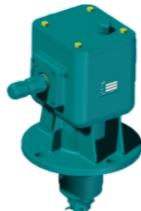
GRUPO 80 HP 80 HP GROUP GROUPE 80 HP GRUPPE 80 HP