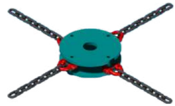
CADENAS GR-8 Ø16 mm GR-8 Ø16 mm CHAINS CHAÎNES GR-8 Ø16 mm. KETTE GR-8 Ø16 mm.