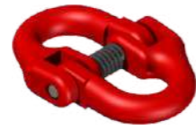
ENGANCHE RÁPIDO CADENA QUICK HTICH CHAIN ATTELAGE RAPIDE CHAÎNE SCHNELLKUPPLUNG FÜR KETTE