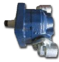
MOTOR DE ENGRANAJES GRUPO III Pmax=250 bar GEARED MOTOR GROUP III Pmax=250 bar MOTEUR ENGRENAGES GROUPE III Pmax = 250 bar MOTOR GETRIEBE GRUPPE III Pmax=250 bar